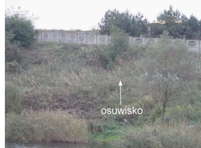
Fot.34 Stok osuwiska w Stęszewie