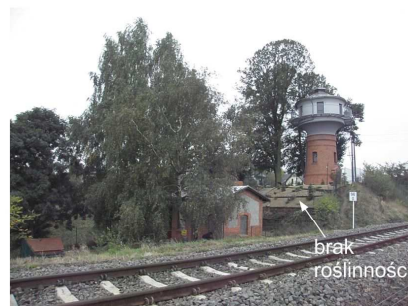
Fot.36 Stok rejonu osuwiska w Stęszewie w okolicy wieży ciśnień