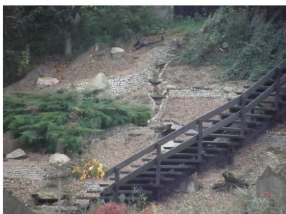
Fot.35 Fragment stoku osuwiska w Stęszewie pozbawiony roślinności wysokiej