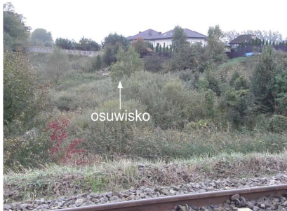
Fot.33 Osuwisko w Stęszewie z zabudowaniami w koronie osuwiska