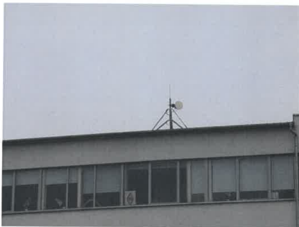
Widok instalacji radiokomunikacyjnej Stacja Netia KORNB026 - KORNM00014 Gądky, ul. Magazynowa 19.