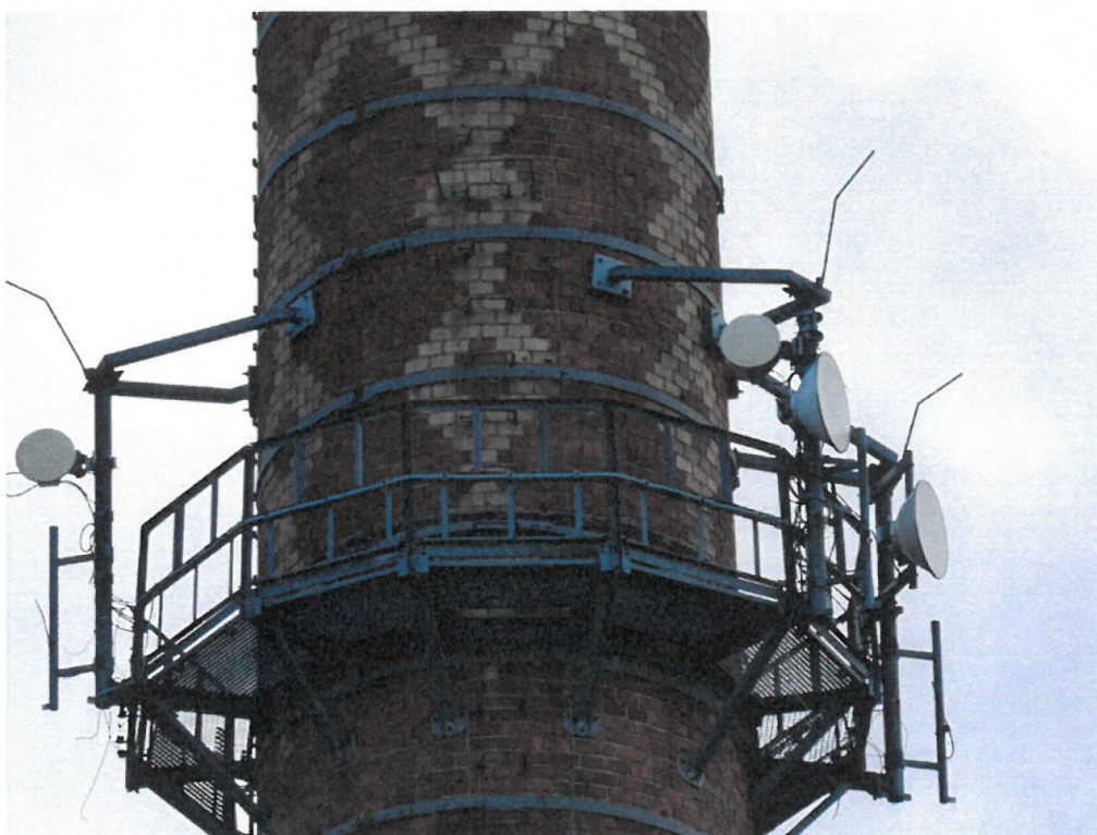
Widok instalacji radiokomunikacyjnej Stacja Netia LBONW001 - LBONM00002 Luboń, ul. Armii Poznań 49.