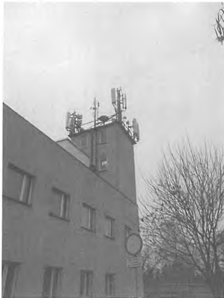
Zal. nr 1: Widok ogólny instalacji radiokomunikacyjnej.