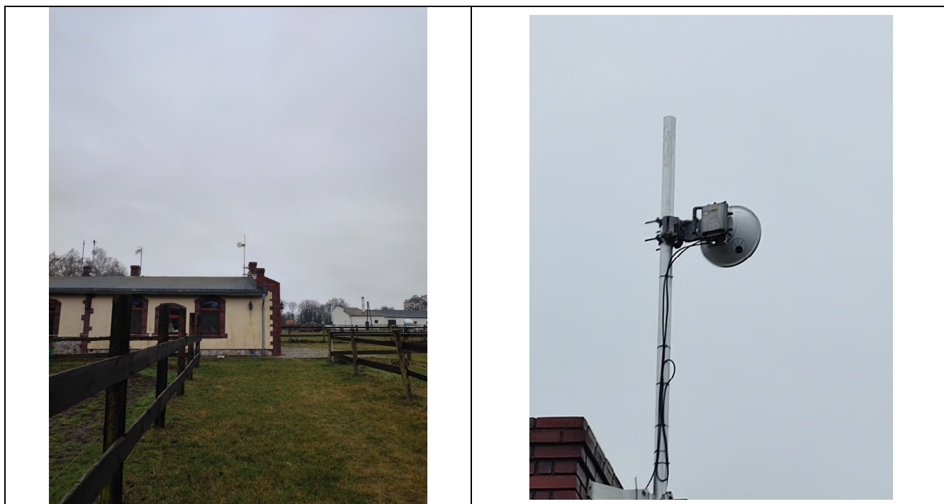
Tabela nr 8

Widok obiektu wraz z zainstalowanym zespołem antenowym