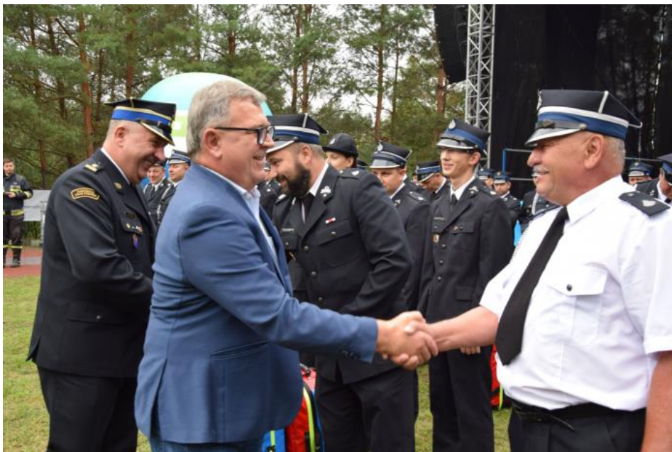
Zdj. Nr 4. Festyn „Bezpieczni w Powiecie Poznańskim”.