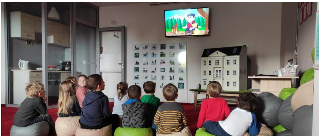
Zdj. Nr 1. Dzieci podczas zajęć edukacyjnych w Sali Edukacyjnej „Ognik”.

Pomieszczenie przypomina mieszkanie, jest w nim kuchnia z wyposażeniem, jadalnia, część wypoczynkowa i część przeznaczona na zabawę. Podłoga wyłożona jest miękką wykładziną, dzieci siedzą na pufach i mają możliwość obracania się w zależności w której części sali prowadzone są zajęcia.