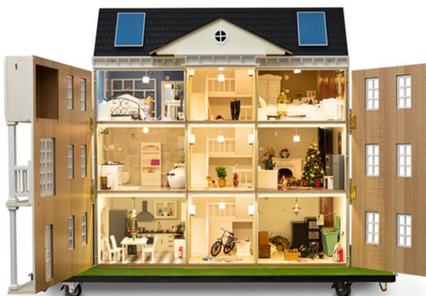
Zdj. Nr 3. Mobilny symulator zagrożeń.

Ważnym elementem jest ściana z naklejkami obrazującymi objawy zatrucia czadem.