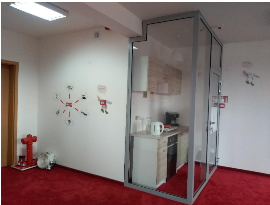
Zdj. Nr 2. Kącik tematyczny w Sali Edukacyjnej „Ognik”.

W pomieszczeniu ukryte są elementy stanowiące potencjalne zagrożenie – jest więc wyrwany ze ściany kontakt, niesprawny czajnik elektryczny, deska do prasowania z wypaloną dziurą, przykryta lampka nocna, zakryta kratka wentylacyjna, źle odłożone zapalniczki, kominek przy którym znajduje się zbyt blisko usytuowany kosz na śmieci oraz spalane są plastikowe butelki, świeczka znajdująca się zbyt blisko firanki itp. Dzieci mają możliwość odszukania zagrożeń i doprowadzenia do stanu poprawnego.