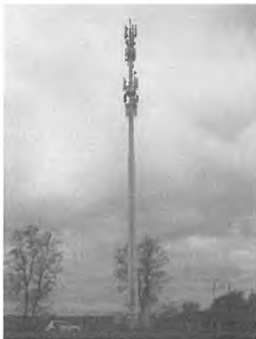
Zał. nr 1: Widok ogólny instalacji radiokomunikacyjnej.

Koniec sprawozdania. Sprawozdanie zawiera dodatkowo załączniki nr 1 i 2.