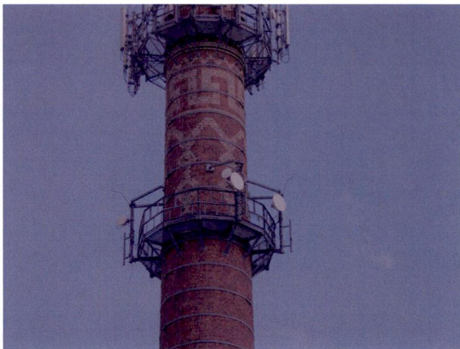
Widok instalacji radiokomunikacyjnej Stacja Netia LBONW001 - LBONM00002 Luboń, ul. Armii Poznań 49.