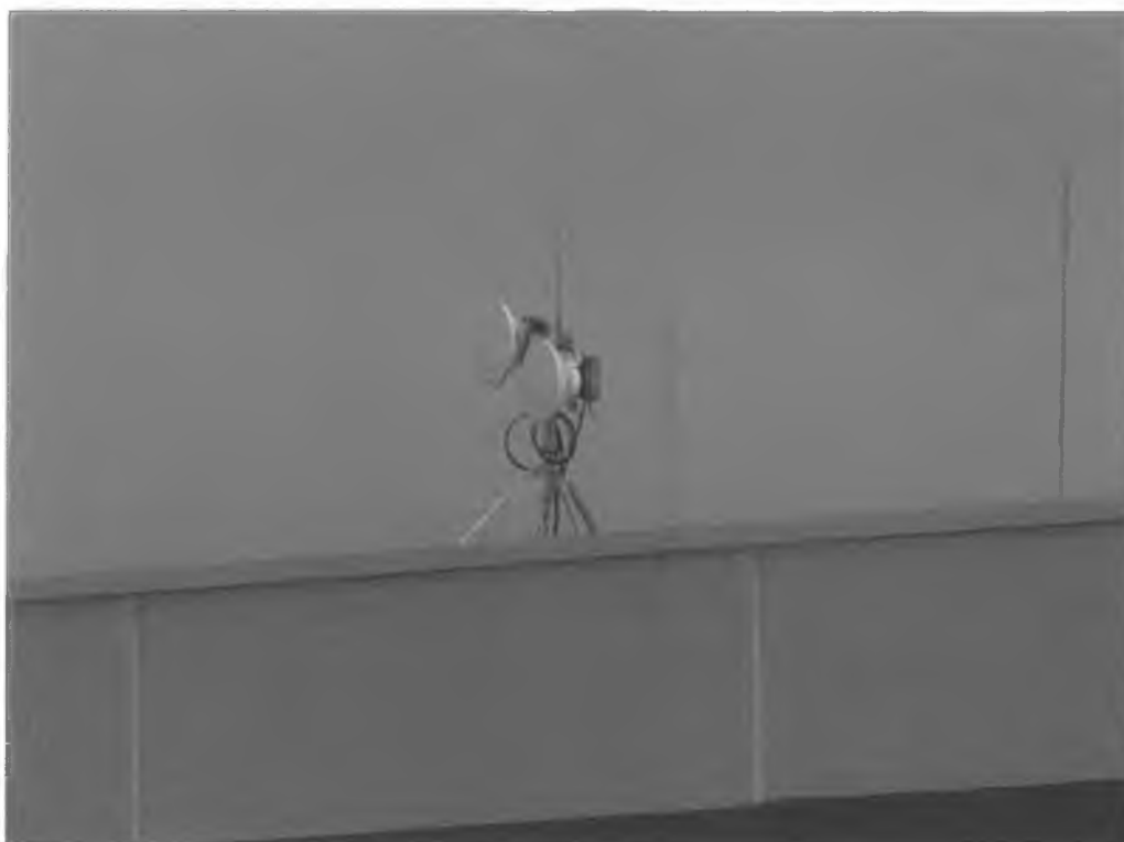
Widok instalacji radiokomunikacyjnej Stacja Netia KORNB130 - KORNM00054 Robakowo, ul. Stachowska 17D.