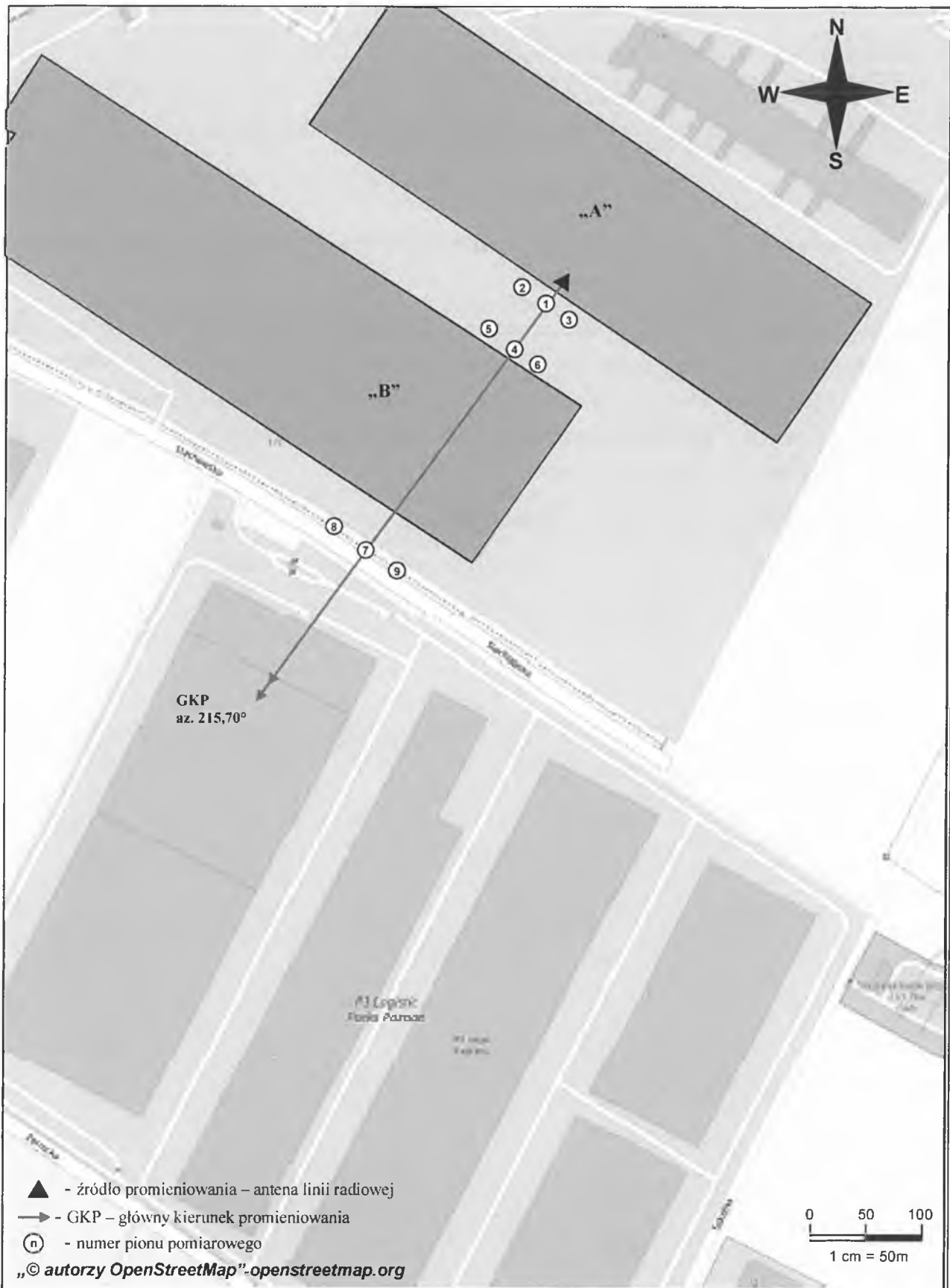
Rys. 1. Usytuowanie punktów i pionów pomiarowych w otoczeniu instalacji radiokomunikacyjnej Stacja Netia KORNB130-KORN00054 Robakowo, ul. Stachowska 17D