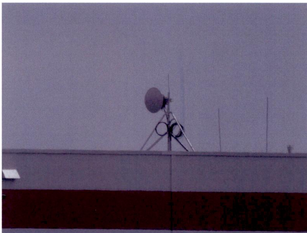
Widok instalacji radiokomunikacyjnej Stacja Netia KORNB137 - KORNM00059 Robakowo, ul. Stachowska 16.