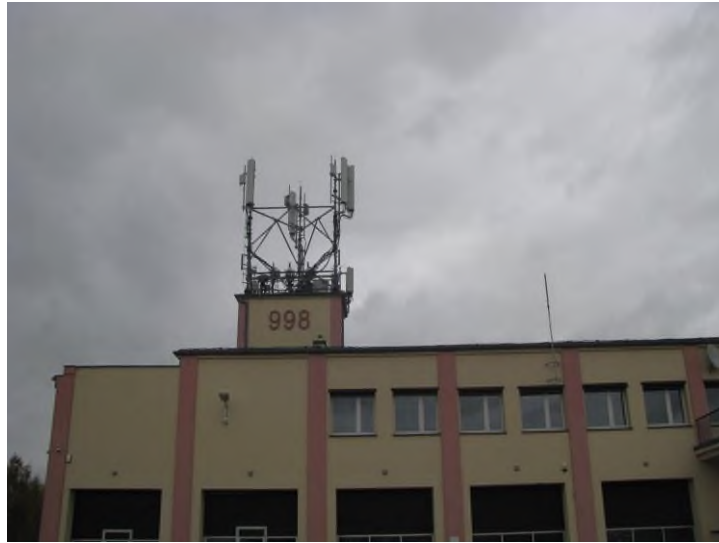
Zaf. nr 1: Widok ogólny instalacji radiokomunikacyjnej.