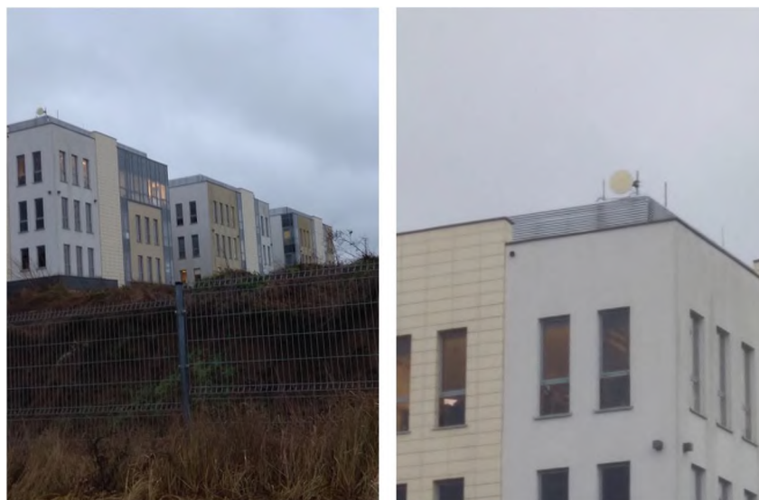
Widok obiektu wraz z zainstalowanym zespołem antenowym