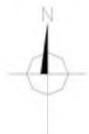
Azymuty anten Orange Polska S.A.