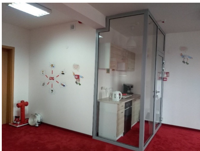
Zdj. Nr 2. Kącik tematyczny w Sali Edukacyjnej „Ognik”.

Podstawą zajęć jest tablica magnetyczna obrazująca prawidłowe i nieprawidłowe zachowania. Złe zachowania pokazuje mały piesek „rozrabiaka”, duży pies w mundurze strażaka pokazuje prawidłowe zachowania narysowane na kafelkach z magnesami, którymi zakrywane są złe zachowania narysowane na tablicy. Zagrożenia wskazane na tablicy są odzwierciedlone na terenie Ognika. Oprócz pokazania ich na tablicy zadaniem dzieci jest odnalezienie ich w Sali. Ponadto na tablicy znajdują się również zagrożenia tematyczne typu bezpieczeństwo nad wodą, zagrożenia związane z wypalaniem traw, fajerwerkami itp.