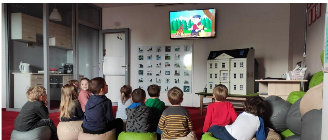
Zdj. Nr 1. Dzieci podczas zajęć edukacyjnych w Sali Edukacyjnej „Ognik”.

Pomieszczenie przypomina mieszkanie, jest w nim kuchnia z wyposażeniem, jadalnia, część wypoczynkowa i część przeznaczona na zabawę. Podłoga wyłożona jest miękką wykładziną, dzieci siedzą na pufach i mają możliwość obracania się w zależności w której części sali prowadzone są zajęcia.