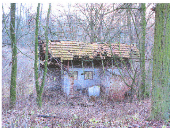
Nieszawa – pałac i park. Stan obecny.

Stan zabytkowych parków jest bardzo zróżnicowany. Niektóre zachowane są w stanie dobrym, dość duża grupa – w stanie dostatecznym. Najwięcej jest jednak parków w stanie złym. Ponieważ często stanowią one jedyny zadrzewiony teren w miejscowości – dlatego należy zachować istniejący drzewostan oraz dążyć do przywrócenia parkom ich dawnej świetności. Większość parków wymaga sporządzenia aktualnych inwentaryzacji drzew oraz projektów rewitalizacji, obejmujących odtworzenie dawnego drzewostanu, nasadzenia uzupełniające oraz usuwanie z ich terenu obiektów dysharmonijnych. Po wykonaniu w/w prac należy systematycznie przeprowadzać zabiegi pielęgnacyjne w celu niedopuszczenia do ponownej degradacji.