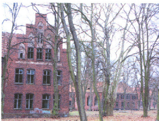
Owińska – jeden z pawilonów Zakładu dla Obląkanych. Stan przed 1939 i obecnie.

W takich wypadkach konieczne jest opracowanie stosownej dokumentacji historyczno-architektonicznej i budowlano-remontowej, następnie – przeprowadzenie prac restauratorskich. W skrajnych przypadkach należy podjąć kroki prawne w celu przymuszenia właścicieli lub użytkowników do przeprowadzenia remontów.