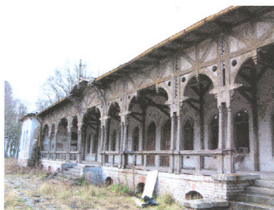
Biedrusko – Kasyno Oficerskie. Stan przed 1918 r. i obecnie.